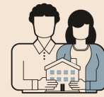
CONVIVENZA DI FATTO DICHIARATA ALL'ANAGRAFE